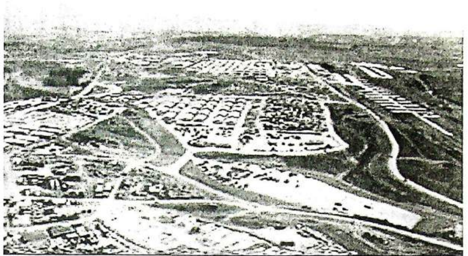
De VS-basis Bondsteel in Kosovo. Een van de grootste VS-bases buiten de VS. Ter bescherming van de bevolking?

Ik herinner me nog goed het moment dat de prospectus van de Treuhand, indertijd in Duitsland aan-