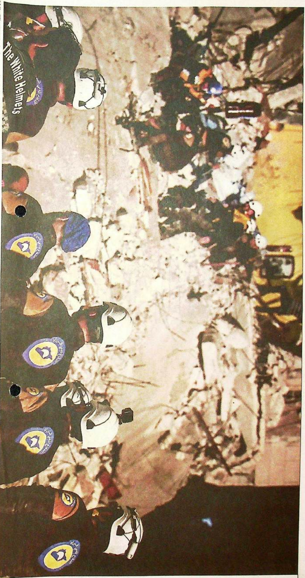
Vrijwilligers van hulporganisatie De Witte Helmen in actie in Syrië. Het geschil tussen de Volkskrant en De Groene draaide onder meer om vermeende fraude door een voor de hulporganisatie centrale figuur.