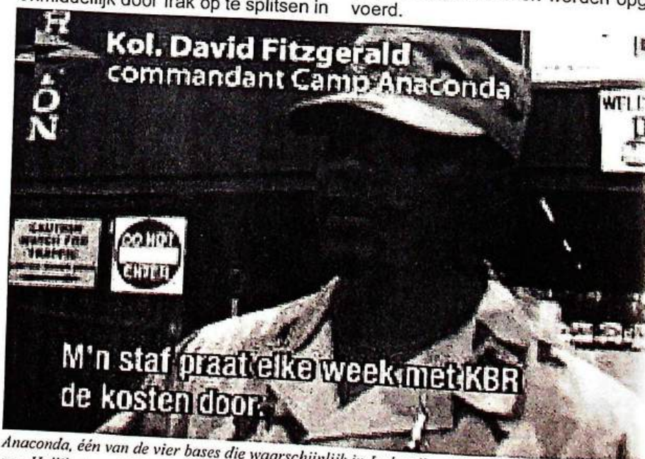
Anaconda, één van de vier bases die waarschijnlijk in Irak zullen blijven. Een dochterbedrijf van Halliburton, KBR, verzorgt hier o.a. de catering, de logistiek etc. Om een idee te geven alleen al 105.000 maaltijden per dag. Op 28.000 soldaten zijn er 8.000 particuliere werknemers.

In het volgende nummer van de anti-fascist zullen we weer ingaan op de circusvoorstellingen die door de gelijke schijntribunalen worden opgevoerd.