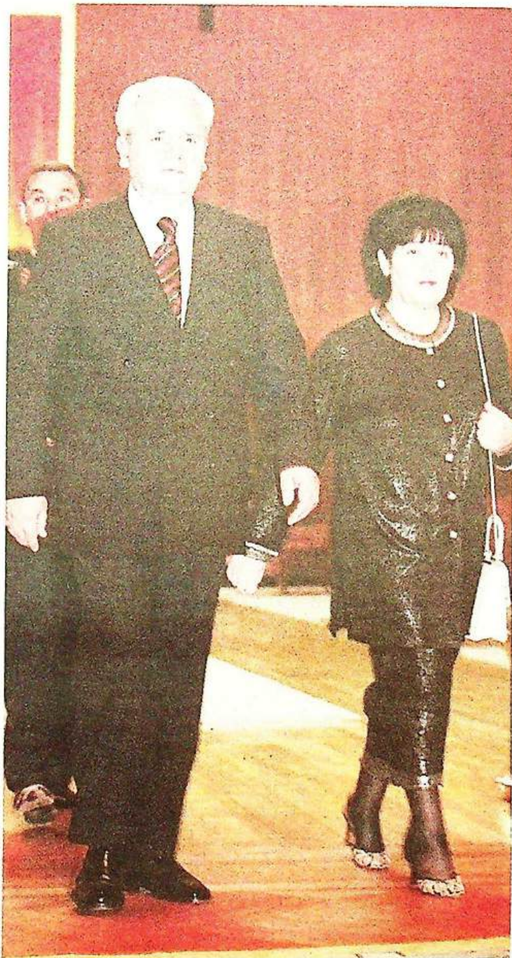
Het echtpaar Milosevic-Markovic in 1999.

Milosevic was de leider op de voorgrond. De president en Servische nationalist onder wie de Joegoslavische federatie in een reeks bloedige conflicten uiteenviel. Kroaten, Bosnische moslims en Albanezen uit Kosovo wilden onder het Servische juk vandaan. Milosevic zette het grote Joegoslavische leger tegen hen in om dat te verhinderen. Hij werd vervolgd wegens oorlogsmisdaden, maar stierf in 2006 in een cel van het Joegoslaviëtribunaal in Scheveningen, voor het proces was afgerond. Milosevic' aanpak was in lijn met