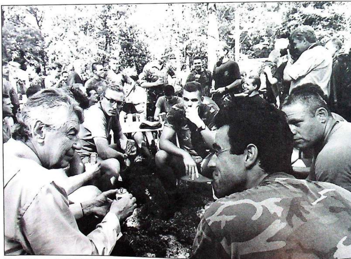
Premier Kok op zondag 23 juli 1995 in gesprek met militairen van Dutchbat, die de dag tevoren via Potocari uit Srebrenica waren teruggekeerd.

nale gemeenschap. Op 19 juli komen vluchtelingen nauwelijks aan het woord. In de Volkskrant staat nog wel een verhaal met persoonlijke getuigenissen over de vlucht van de vierduizend mensen. ('Niemand zal ooit weten wat we doorstonden'). Op 19 juli stelt De Milliano, 'Na alles wat ik gehoord en gezien heb, zie ik geen aanleiding voor een onderzoek naar de houding van de Nederlandse blauwhelmen ter plekke. Maar alleen al om de geruchtenstroom tegen te gaan dat ze onvoldoende zouden hebben gedaan om de vluchtelingen te beschermen, zou het goed zijn als het kabinet met een volstrekt eenduidig verhaal komt over wat zich heeft afgespeeld in de verhouding tussen Serviërs, vluchtelingen en Nederlandse blauwhelmen.' Hij pleit voor een reconstructie van de feiten, waarmee hij doelt op de