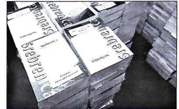
Stapels NIOD-rapporten op 9 april 2002 in het perscentrum Nieuwspoort in Den Haag.

Na de Tweede Wereldoorlog hield maarschalk Tito de veelvolkerenstaat bij elkaar door zich onder andere te engageren in de Beweging van Niet-gebonden Landen, die daarmee buiten de Koude Oorlog tussen Oost en West trachtte te blijven. Tijdens een topconferentie van die organisatie eind jaren zeventig in Belgrado bleek een hechte samenhang van Joegoslavië al schijn. Joegoslavië-kenners konden toen al aanwijzen welke kopstukken de in onberispelijk wit uniform geklede Tito nog wel dulden, maar reeds zonnen op een andere toekomst voor hun eigen staat. Begin jaren tachtig maakte de Oost-Europa-expert van de Volkskrant , de historicus wijlen Hendrik de Jong, een reis door Joegoslavië en keerde terug met dramatische indrukken: 'Daar gaat het