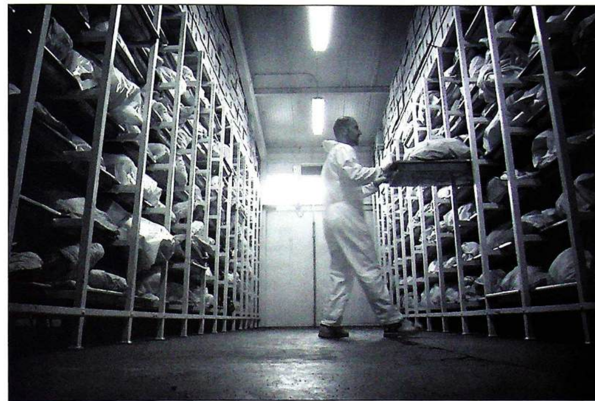
Een forensische onderzoeker aan het werk in het lijkenhuis van Tuzla, waar meer dan 3500 slachtoffers van het Srebrenica-drama wachten op identificatie.

Den Haag had gezeten. 'Voorhoeve bewijst zich als juiste man op juiste plaats'. Er was nog geen spoor van twijfel over de rol van Dutchbat.