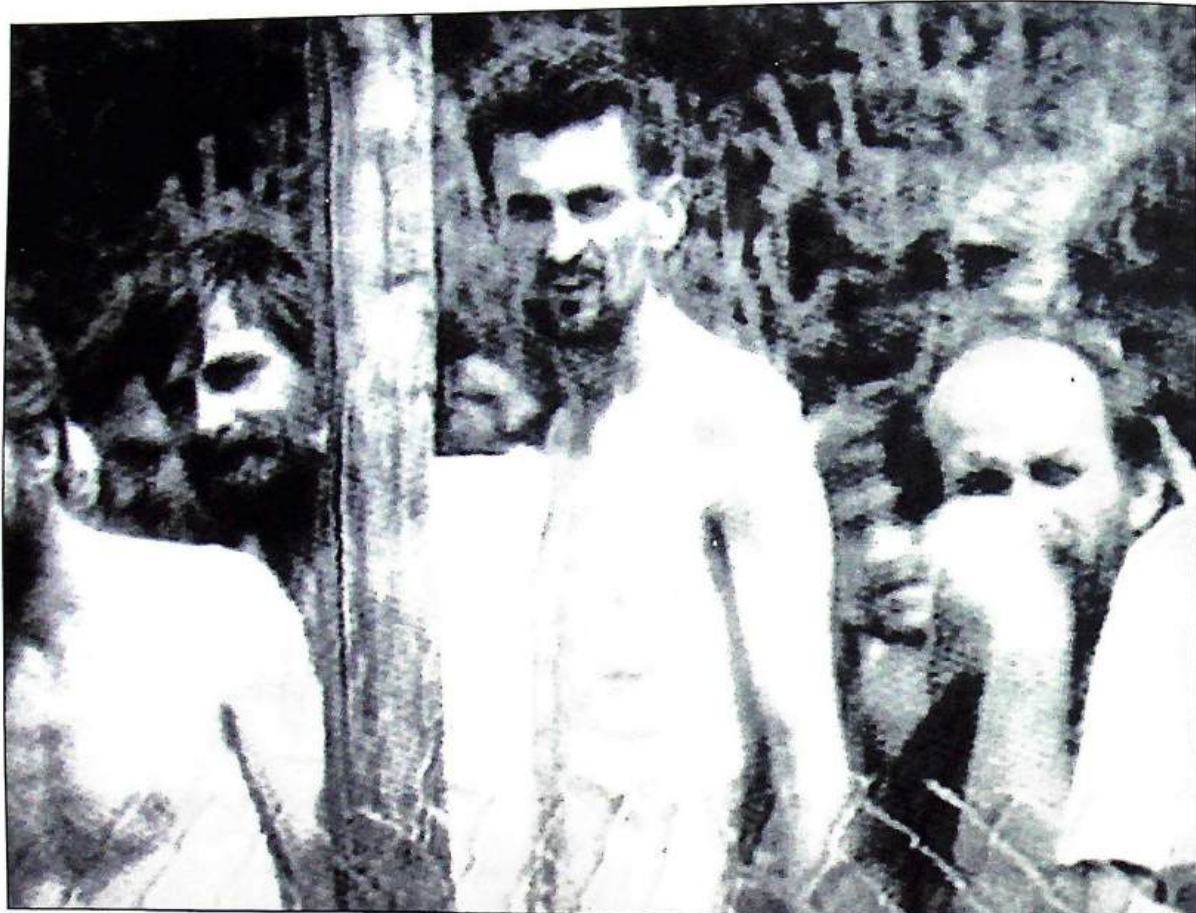
Een van de beelden uit het Omarska-kamp, augustus 1992.

in Bonn de stellige verzekering gekregen dat Stefan Schwarz een 'degelijke en betrouwbare bron' was. En omdat op de redactie de Serviërs algemeen beschouwd werden als de 'kwaden', stond niets meer de publicatie van het artikel in de weg. In een interview van Beusekamp met Stefan Schwarz dat op 14 januari 1993 in de Volkskrant werd gepubliceerd - 'Duitse parlementariër Schwarz inventariseert misdaden Serviërs' - werd het omstreden artikel gecorrigeerd. Het Algemeen Dagblad was overigens wel zo zorgvuldig geweest om het verhaal van Schwarz eerst te onderzoeken. De krant kwam daarbij tot de ontstellende conclusie dat er niets van klopte. Westerman: 'De redactie heeft mij nooit benaderd om dat geval eerst uit te zoeken. En ik heb zelf evenmin iets ondernomen.'