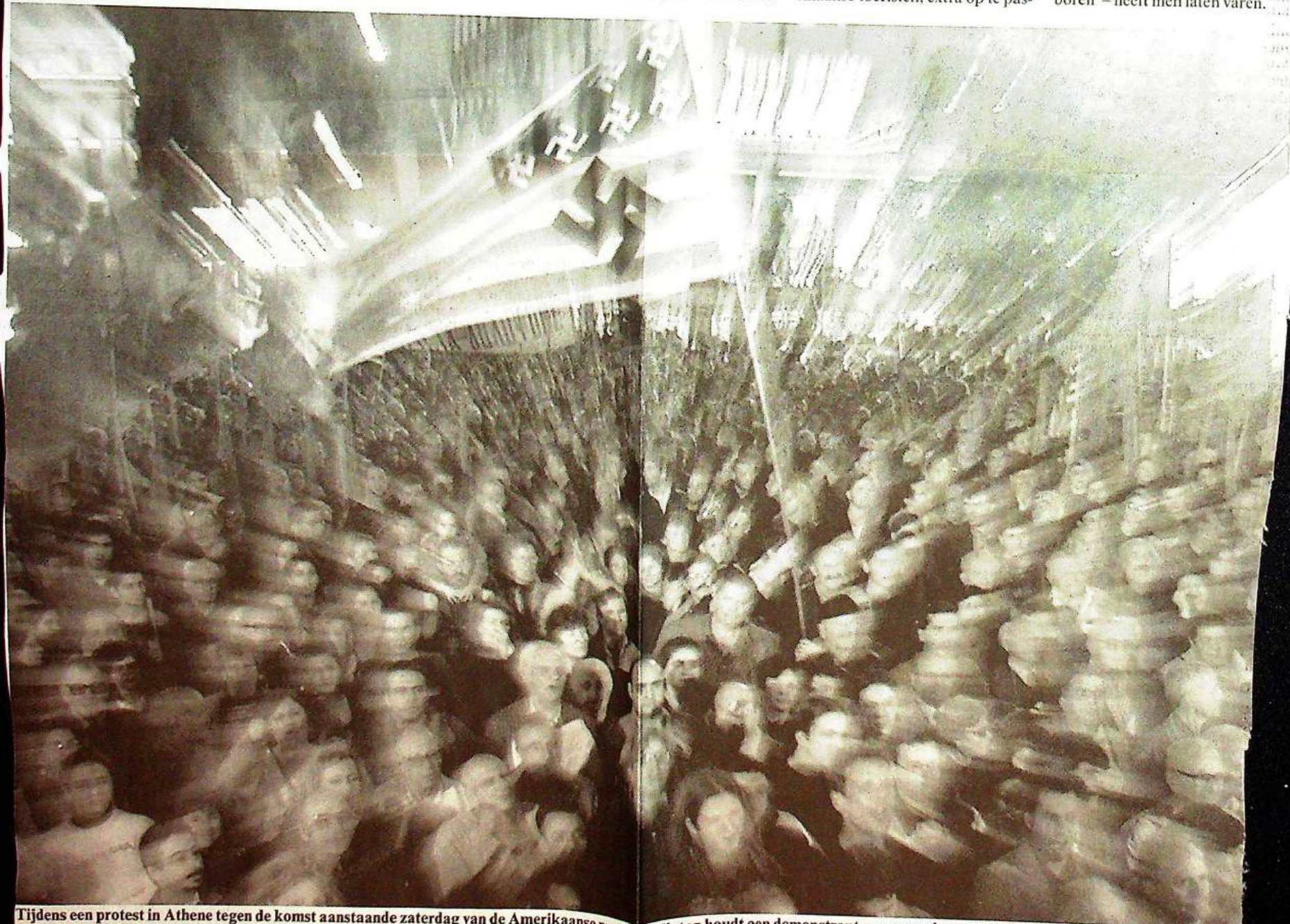
Tijdens een protest in Athene tegen de komst aanstaande zaterdag van de Amerikaanse president Clinton houdt een demonstrant een exemplaar van de Amerikaanse 'Stars and Stripes' omhoog waarvan de gebruikelijke sterren door hakenkruisen zijn vervangen.

Zowel programma als agenda van het bezoek wordt geheim ge- houden. Zeker is dat Clinton het parlement niet zal toespreken, maar zich rechtstreeks tot de Grie- ken zal richten in een toespraak in het Concertgebouw, op honderd passen van de ambassade. Het idee dat hij deze toespraak zou houden op de Pnyx - de heuvel waar in de oudheid 'de democratie werd ge- boren' - heeft men laten varen.